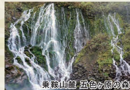
乗鞍山麓 五色分原の森

飛騨山脈(北アルプス)は「日本の屋根」とも呼ばれ、槍穂高連峰を筆頭に日本列島を東西に分画し、太平洋と日本海を分ける中央分水嶺の最高点は乗鞍岳の山頂にあります。コノドントと呼ばれる日本最古(4億7000万年前)の化石に始まり、笠ヶ岳や槍穂高の火山活動、また大地の隆起や侵食によって形成され、巨大な壁となって現在に至っています。この地域は5億年という時間を体感できる日本有数の場所です。