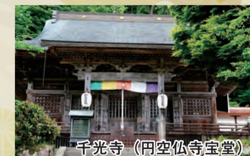
千光寺(円空仏寺宝堂)

上宝町本郷にある歴史館。地域の伝統文化や貴重な資料を後世に残すとともに、その歴史を多くの方に知っていただくことを目的とした施設です。