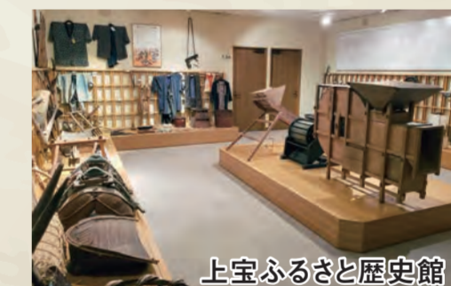
上宝ふるさと歴史館

上宝町本郷にある歴史館。地域の伝統文化や貴重な資料を後世に残すとともに、その歴史を多くの方に知っていただくことを目的とした施設です。