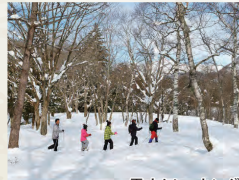
雪山トレッキング

丹生川ダムの上流域にある溪流。河床は美しい一枚岩で滑らかに水を流し、川遊びの好適地となっています。