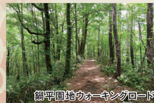
鋼平園地ウォーキングロード

スノーシュー(西洋かんじき)をはいて、白銀の世界へ! 夏場は草木が生い茂り入ることのできない森の中も、雪が積もれば入ることができます。雪の中のハイキングで、是非新しい世界を発見してください。