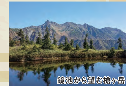
鏡池から望む槍ヶ岳