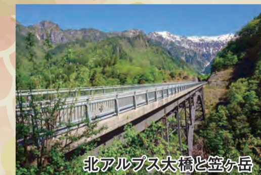
北アルプス大橋と笠ヶ岳