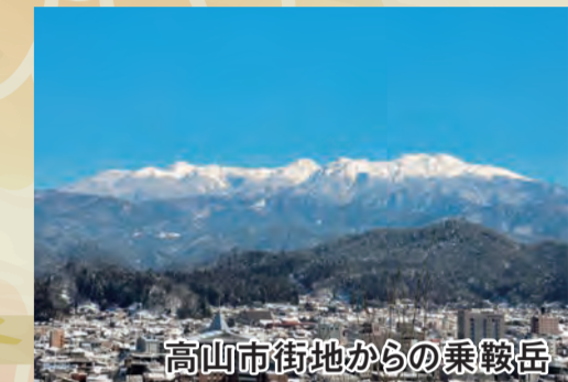
高山市街地からの乗鞍岳